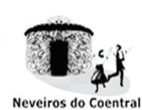
Neveiros do Coentral